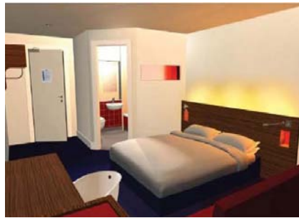
Habitación Familiar Interiores